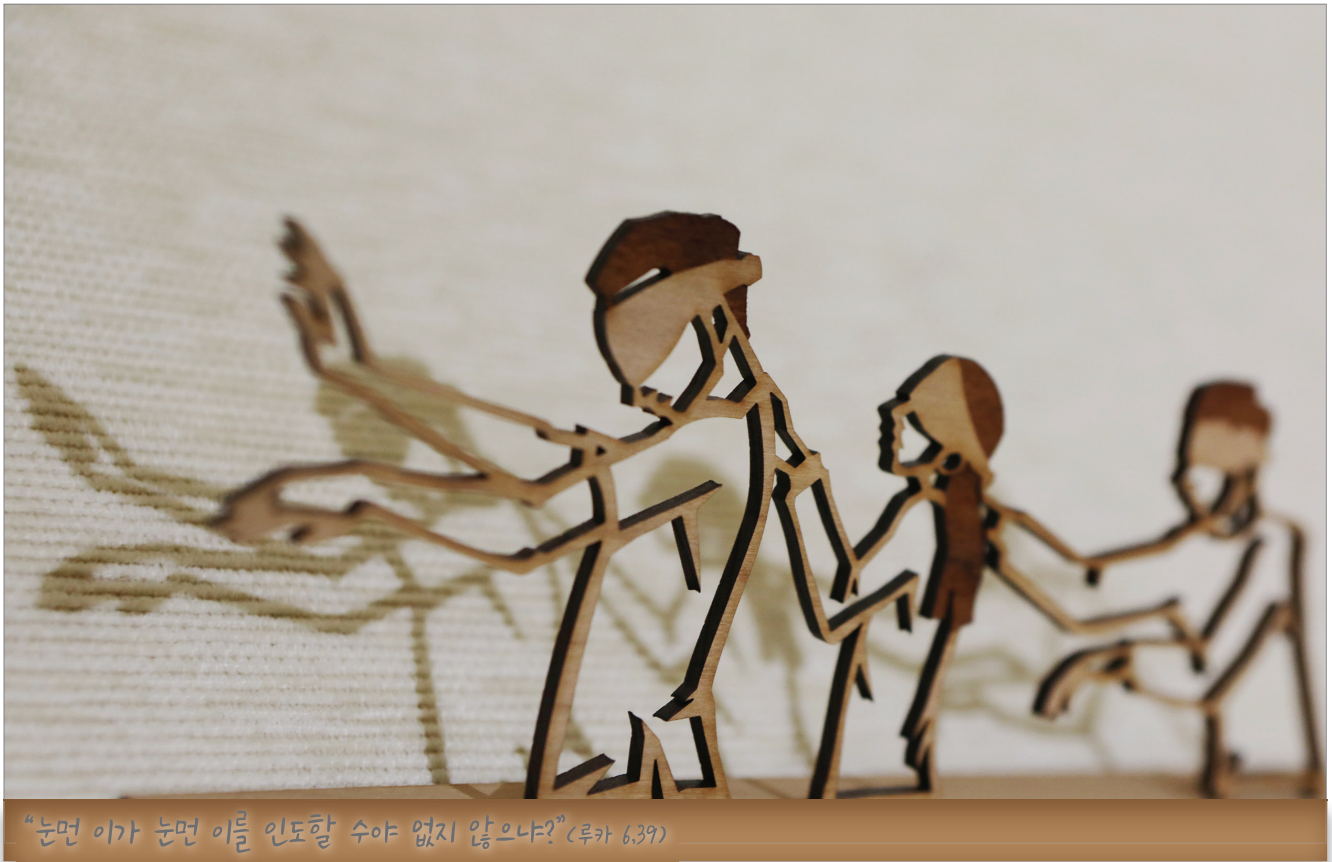
작품 : 서영호 도미니코 (서면성당·부산가톨릭미술인회)