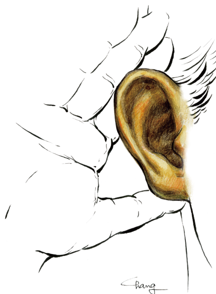
글. 장정에 마리아고레피 시인(만덕성당) 그림. 최창임 프란치스카 화가(성가정성당)