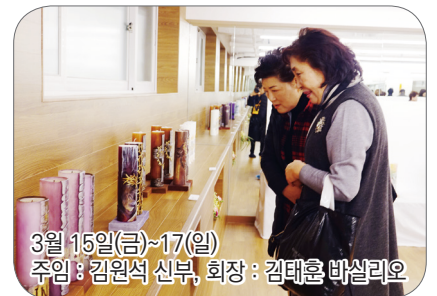
3월 15일(금)~17일(일) 주임 : 김원석 신부, 회장 : 김태훈 바실리오