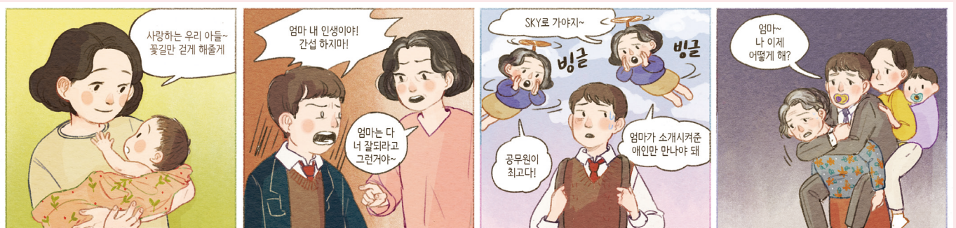
그림. 안나보니따 (황가는 요나나 / 주례성당)

이정희 보리나 북양산성당 · 양산시청소년상담복지센터 youth01@korea.kr