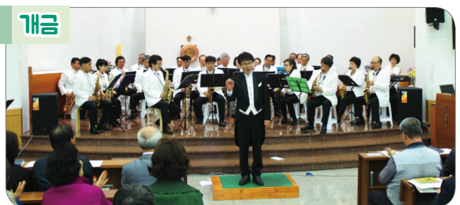
5월 19일(일) 본당 / 주임: 신진수 신부, 회장: 오기복 장주기요셉