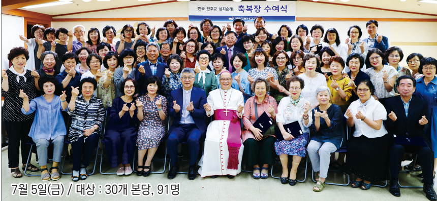
7월 5일(금) / 대상 : 30개 본당, 91명