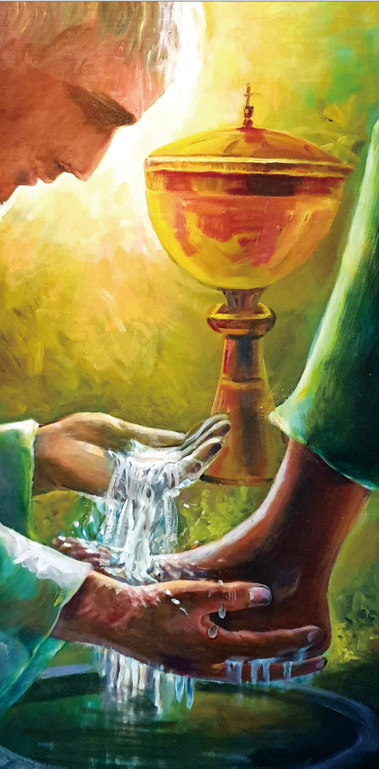
작품 : 신지영 아네스 (청학성당·주보 표지 공모전 수상)