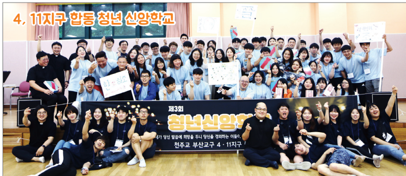
4. 11지구 합동 청년 신앙학교

7월 13일(토)~14일(일) 영도 합지골청소년수련원 / 주제 : 우리가 찾은 희망