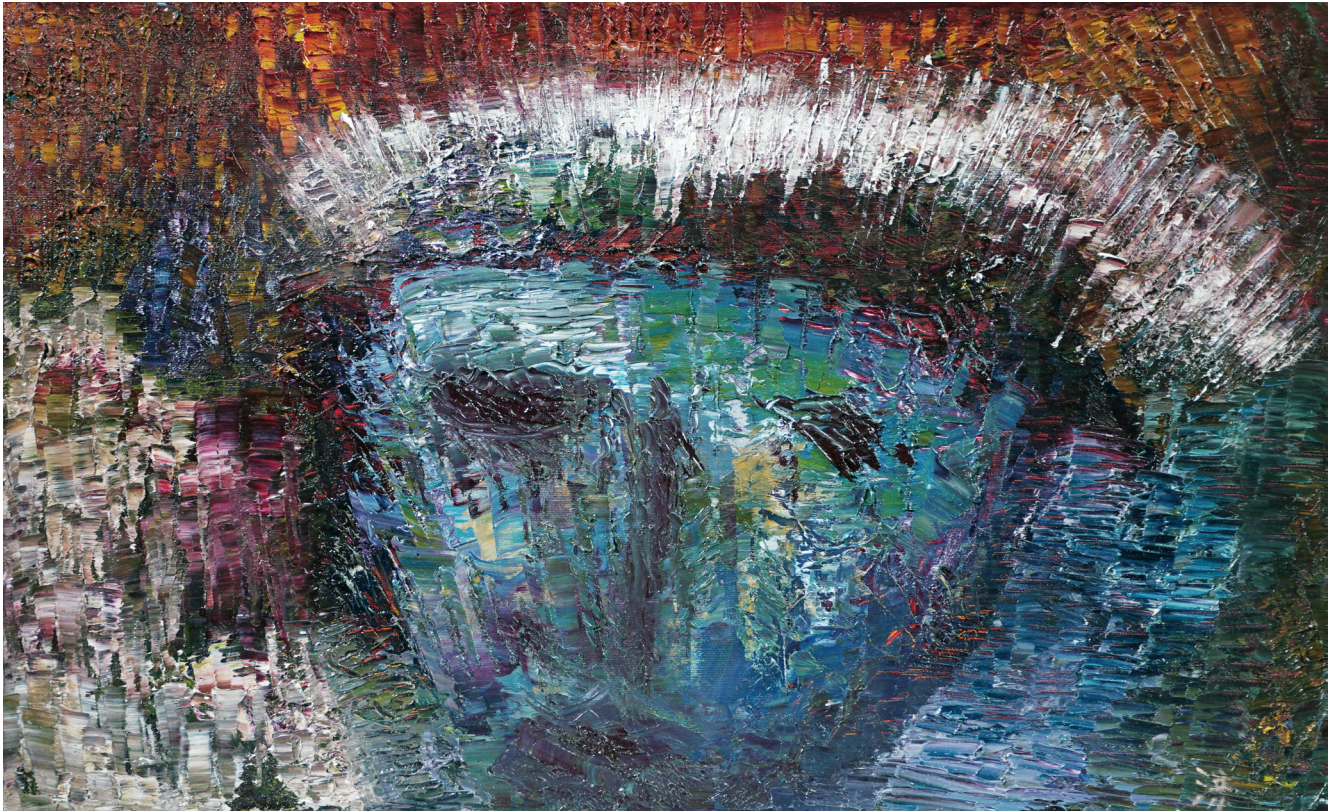
작품 "고통의 예수님" 홍경희 클라우디아 (금정성당 · 주보 표지 공모전 수상)