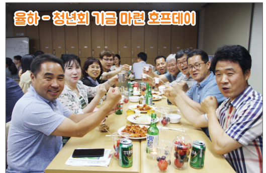
올하 - 청년회 기금 마련 호프데이

7월 13일(토)~14일(일) 영도 합지골청소년수련원 / 주제 : 우리가 찾은 희망