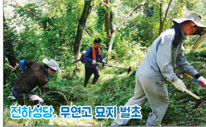
천하성당, 무연고 묘지 벌초