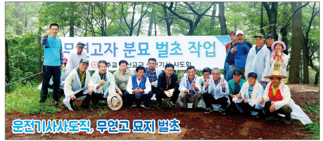
은전기사사도직, 무연고 묘지 벌초

신자뿐만 아니라 지역주민들 모두가 풍성한 한가위를 맞이할 수 있도록 많은 본당 및 단체에서는 무연고 묘지 벌초, 도시락 나눔, 추모음악제 등 다양한 모습으로 주님의 사랑을 실천하고 있다.