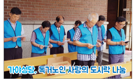
가야성당, 특거노인 사랑의 도시락 나눔