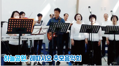
히늘공원, 레파시오 추모음악회