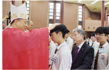
견진 : 대양전자통신고 36명, 데레사여고 53명, 성모여고 34명, 지산고 42명

교구 산하 고등학교의 합동 견진성사가 지난 9월 27일(금) 부산가톨릭대학교 신학대학 성전에서 교구장 손삼석 주교의 주례로 거행되었다.