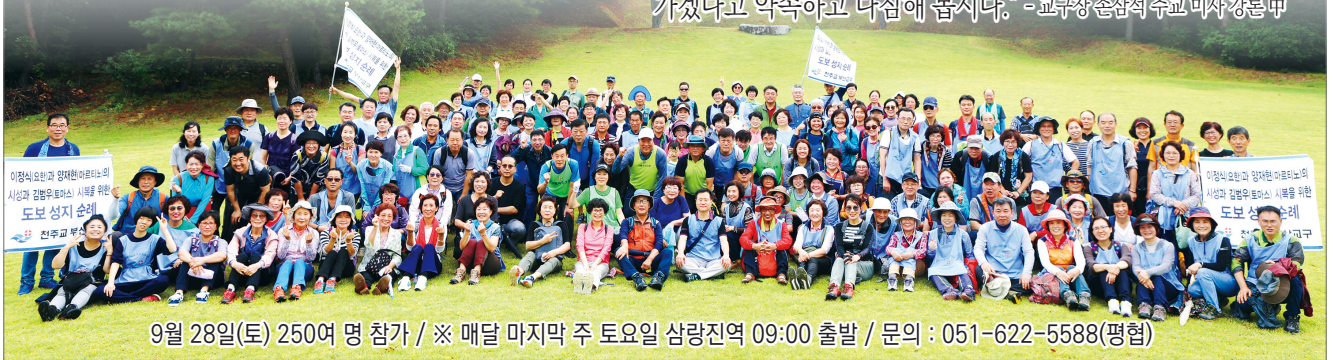
9월 28일(토) 250여 명 참가 / ※ 매달 마지막 주 토요일 삼랑진역 09:00 출발 / 문의 : 051-622-5588(평협)