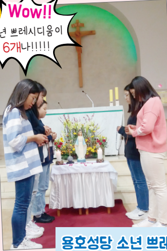
용호성당 소년 브레시디움