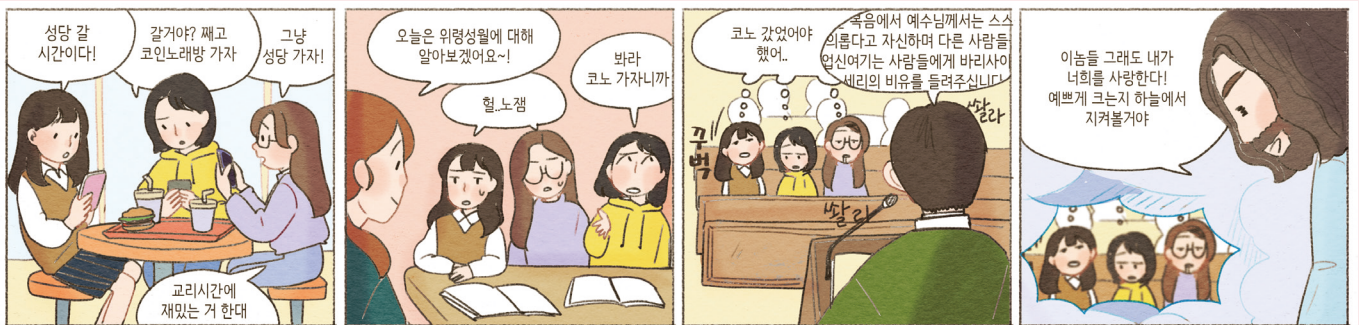
DO U KNOW? GOD KNOW!