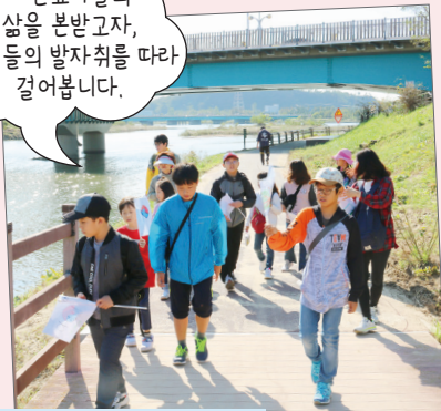
염포성당 복사단 및 주일학교 도보순례