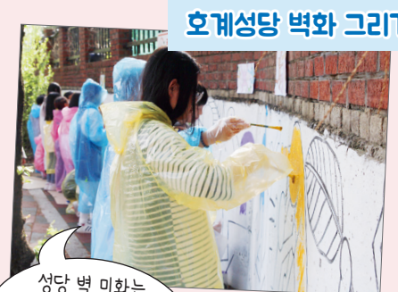
호계성당 벽화 그리기

성당 벽 미화는 저희에게 맡겨주세요! 알록달록 하트뽕뽕! 이쁘게 그려드립니다.