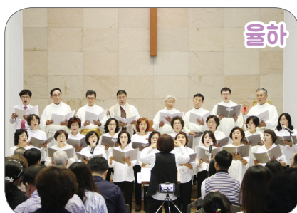
10월 13일(일) 본당 주임 : 최요섭 신부, 회장 : 조인섭 베네딕토