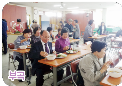
10월 13일(일) 본당 주임 : 김태환 신부, 회장 : 송재일 스테파노