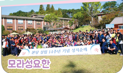
10월 13일(일) 나바위성지 주임 : 김인환 신부, 회장 : 정경자 올리안나