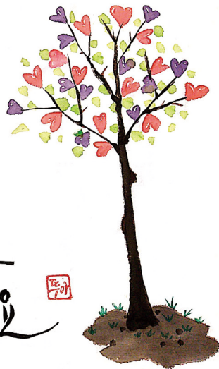
캘리그래피. 김태자 베르베투아 (양산성당)