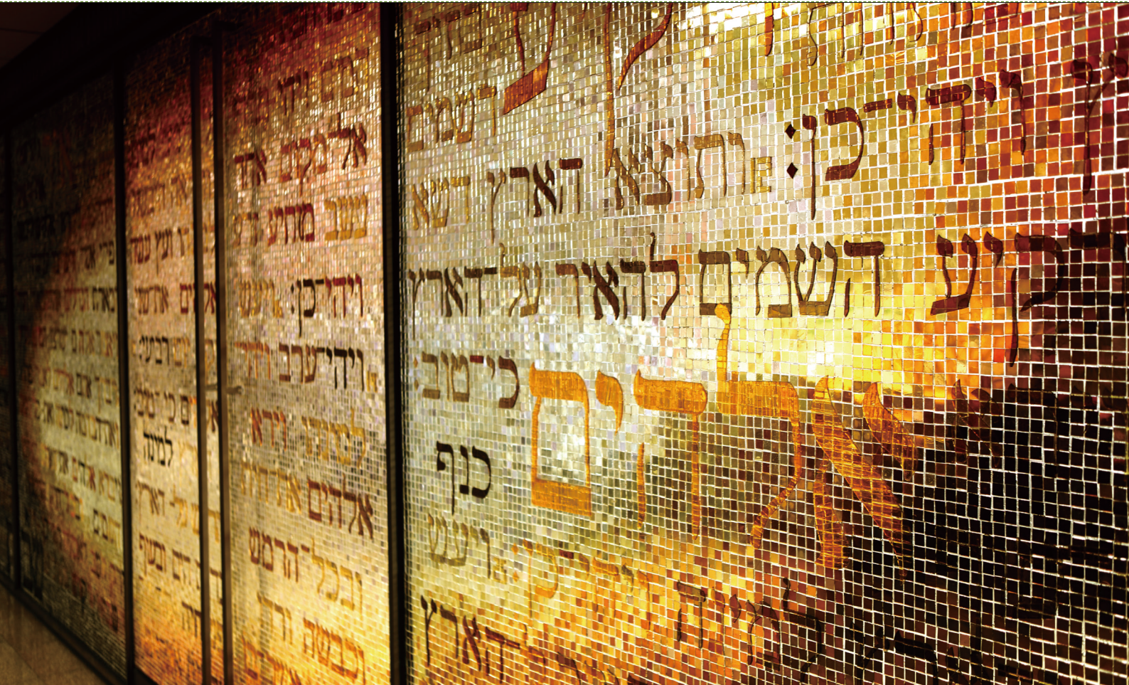
부산가톨릭대학교 신학대학 대성전