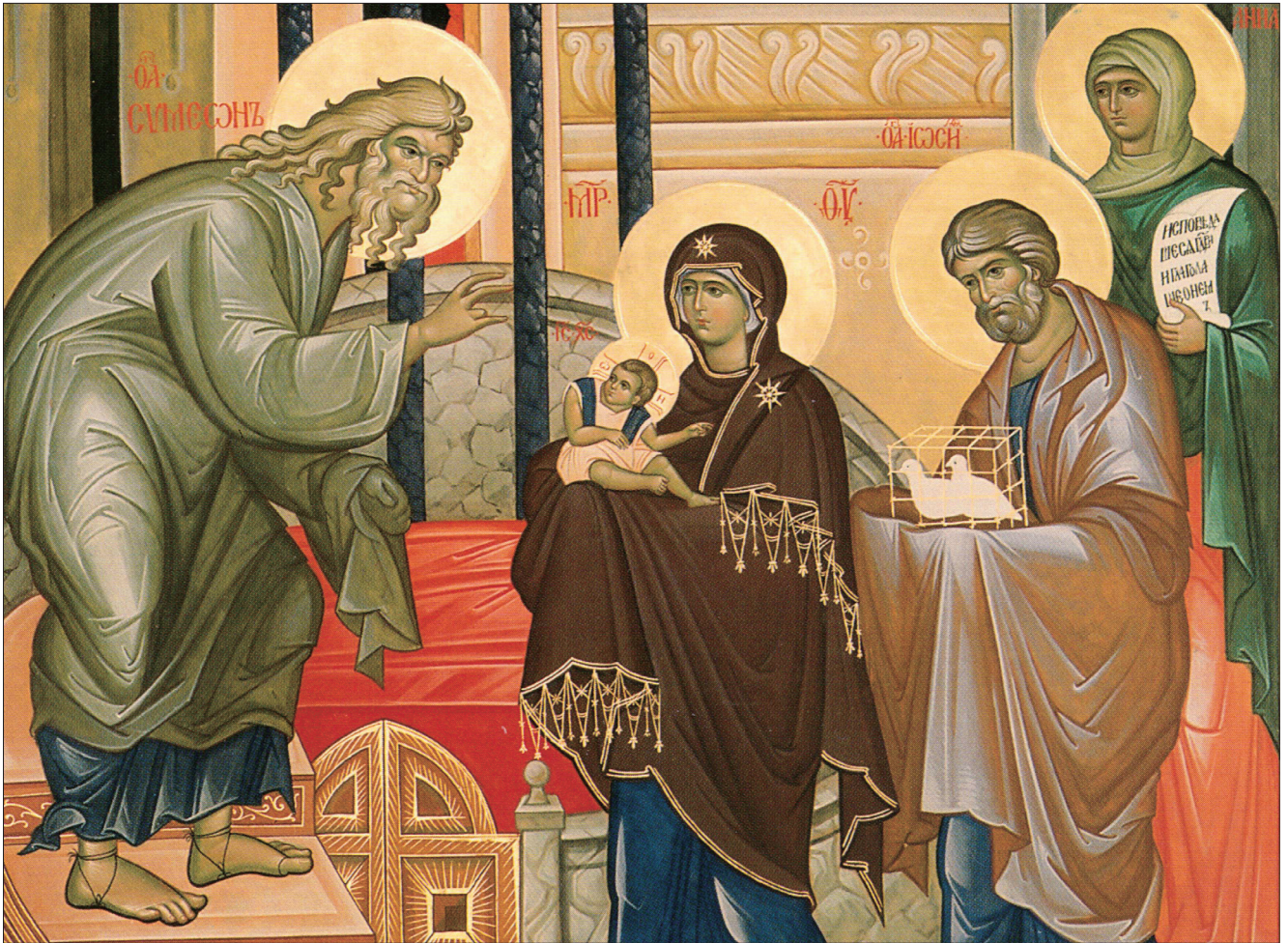
작품 : 이인숙 안젤라 (부산가톨릭대학교 평생교육원 강사) * 표지 이콘에 대한 해설은 3면에 있습니다.

발행 : 천주교부산교구 | 편집 : 전산홍보국 629-8750 (48316) 부산광역시 수영구 수영로427번길 39 | jubo@catb.kr | 인쇄 : 주보인쇄사(809-2078-9)