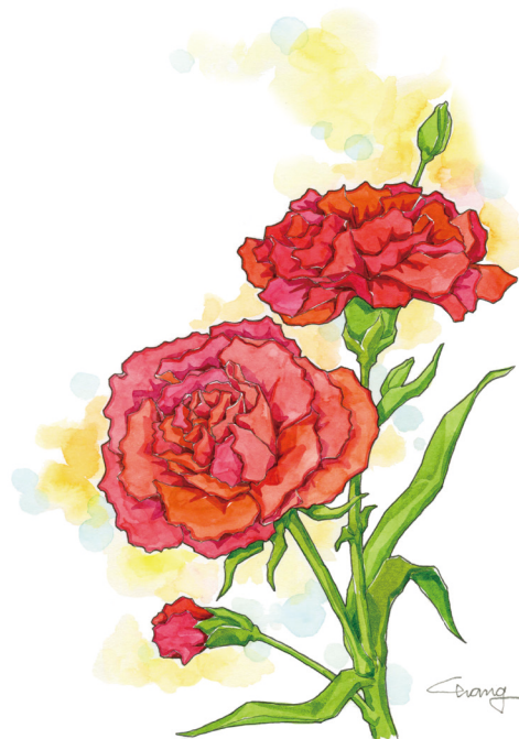
글. 정재분 아가다 동시인(대천성당) 그림. 최창임 프란치스카 화가(성가정성당)

갓난아기 때부터 수없이 불리던 내 이름 사랑이 가득한 목소리는 나를 키우고 바른 길을 찾는 힘이 되었지요 이제는 우리가 부모땁의 이름을 불러드려야 할 때입니다