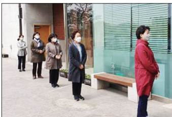
① 일정한 거리를 두고 입장 (1m)