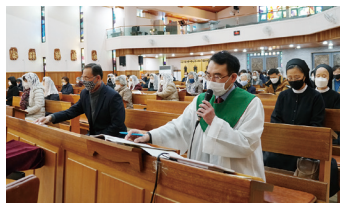
⑥ 충분한 간격을 두고 착석 (1m)