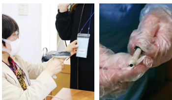
④ 미사 참례자 신원 파악 (방명록 작성 또는 바코드 인식)