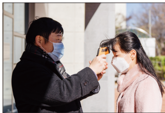
② 체온 측정 (기준 37.5°C)