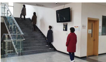
⑤ 일정한 간격을 유지하며 성전 이동