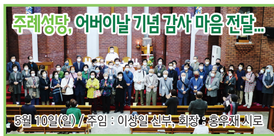
주례성당, 어버이날 기념 감사 마음 전달...