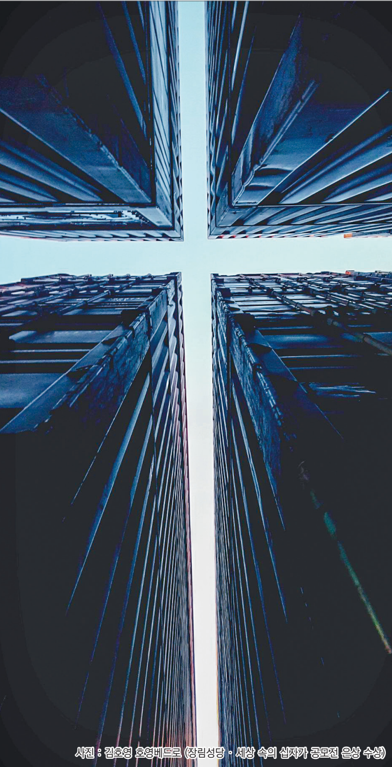
사진 : 김호영 호영베트르 (장립성당 · 세상 속의 십자가 공모전 은상 수상)