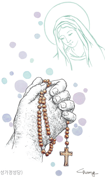
글. 장정에 마리아고레피 시인(만덕성당) 그림. 최창임 프란치스카 화가(성가정성당)

불러도 불러도 지치지 않는 이름 날이 갈수록 그리워지는 이름 내 삶의 마지막에도 입에 담은 이름, “어머니” 그 이름을 담아 천세 번을 연이어 외는 기도, 하늘 은총 깊은 두레박줄 기도, 세상 가장 향기로운 기도, “묵주 기도”