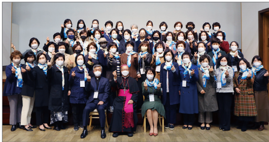
제1강 '소통' (강사: 총대리 신희철 주교) 제2강 '행복' (강사: 교구장 손삼석 주교)

교구 여성연합회가 지난 10월 19일(화) 푸른나무 교육관에서 전국 여성연합회 임원단을 대상으로 교육을 실시했다. 이날 교육은 '소통'과 '행복'을 주제로 특강, 미사 봉헌, 교구청 홍보전시실 관람 등으로 진행됐다.