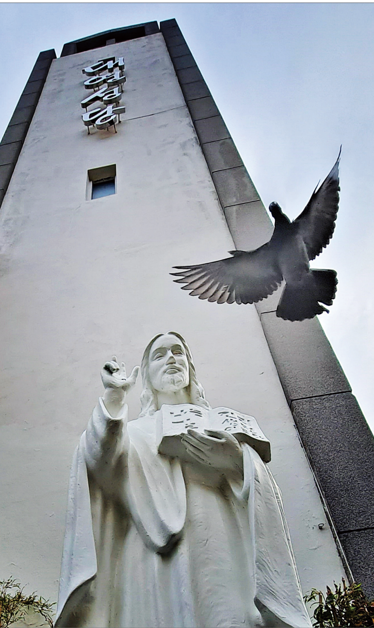
작품 : 김윤범 베드로 (대연성당 · 주보 표지 및 콘텐츠 공모전 당선)

■ 발행 : 천주교부산교구 ■ 편집 : 전산홍보국 629-8750 (48316) 부산광역시 수영구 수영로427번길 39 ■ jubo@catb.kr ■ 인쇄 : 주보인쇄사(809-2078-9)