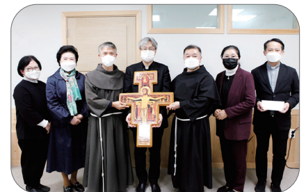
11월 15일(월) 부산교구 성소 발전을 위한 후원금 전달