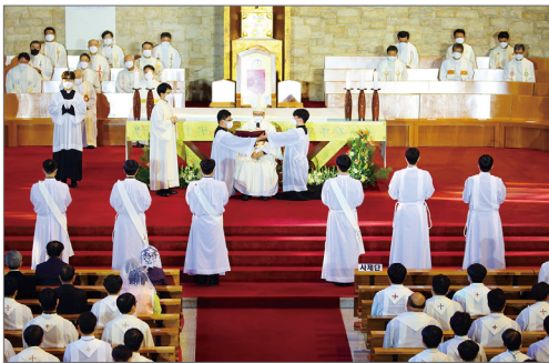
사제직, 부제직 서품 후보자 선발