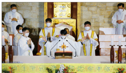
공동집전하는 새 사제