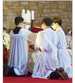
부제로 선발된 이의 서약