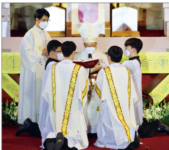
복음서 수여 및 평화의 인사