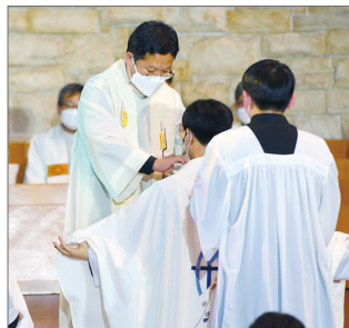
영대와 제의 착의