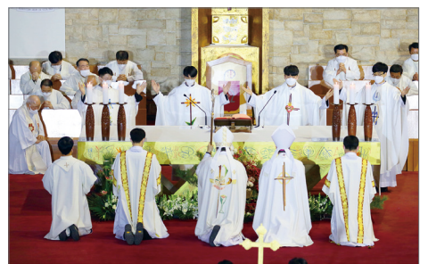
새 사제 첫 강복