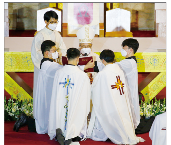
빵과 포도주 수여