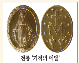
전통 '기적의 메달'