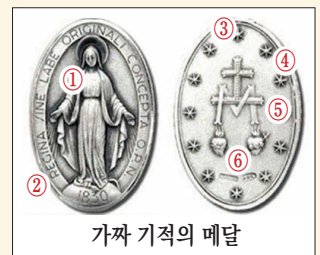
가짜 기적의 메달

성물을 구입할 때에는 제작처나 판매처가 분명한 곳에서 구입하여 주시고, 변형, 왜곡된 성물을 발견하면 바로 폐기해 주십시오. 의문이 있을 때에는 본당 신부님이나 수녀님께 문의하시기 바랍니다.