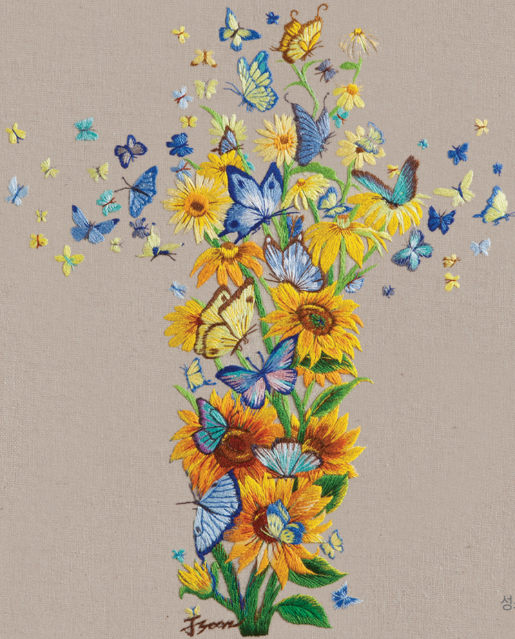
작품 : 김정순 크리스티나 (장산성당·부산가톨릭미술인회)