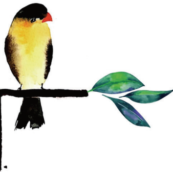
캘리그래피. 손보영 카타리나 (덕계성당)

cpbc 부산가톨릭평화방송 부산 FM 울산 FM 녹산 FM 101.1MHz 94.3 MHz 101.5 MHz