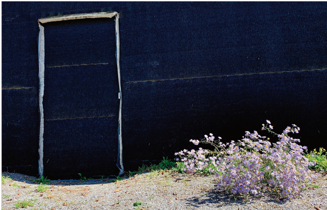
사진 : 최정자 소화테레사 (중앙성당 · 주보 표지 공모전 입선)

발행 : 천주교부산교구 | 편집 : 전산홍보국 629-8750 (48316) 부산광역시 수영구 수영로427번길 39 | jubo@catb.kr | 인쇄 : 주보인쇄사(809-2078~9)