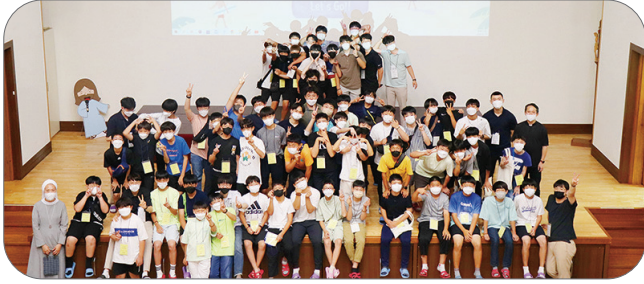
1차(중1) 7월 25일(월), 2차(중2) 7월 26일(화), 3차(중3) 7월 27일(수) 푸른나무교육관 / 성소국(국장: 김인한 신부) 주관