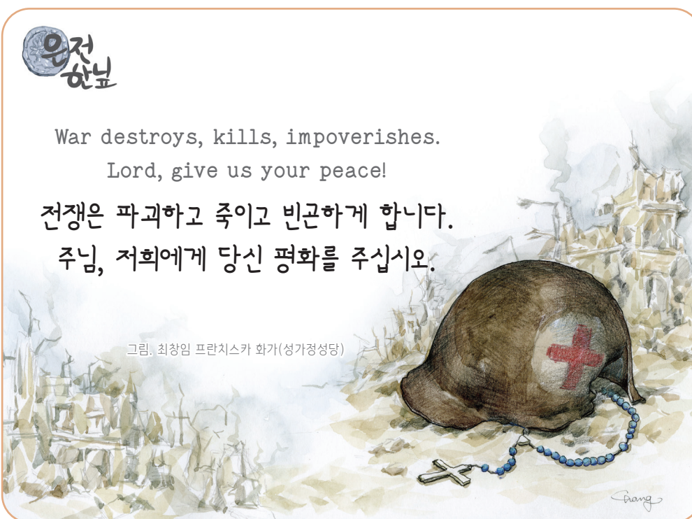
그림. 최창임 프란치스카 화가(성가정성당)