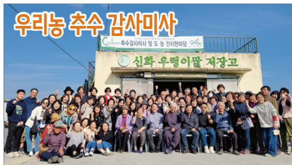
우리농 추수 감사미사 봉헌하며 앞으로도 생명과 땅을 살리는 삶을 살 것을 다짐했다.

우리농촌살리기운동본부(본부장 : 오창석 신부)는 지난 11월 12일(토) 언양읍 신화마을에서 농민, 우리농 활동가, 실무자 등 100여 명과 함께 추수 감사미사를