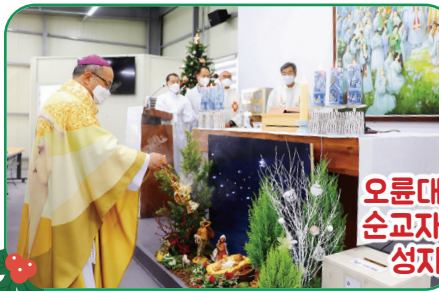
오륜대 순교자 성지